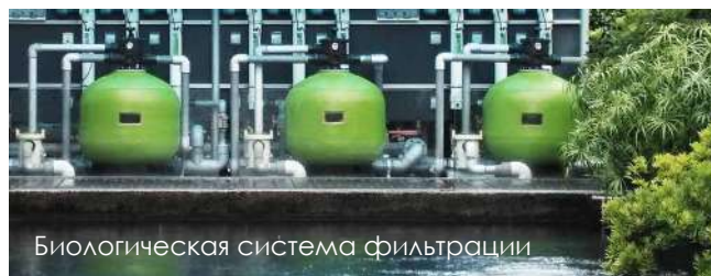
Биологическая система фильтрации

Биологическая фильтрация подразумевает размножение полезных бактерий на биологическом фильтрующем материале в баке фильтра. Полезные бактерии могут эффективно превращать аммиак в нитриты, а затем в менее вредные нитраты.